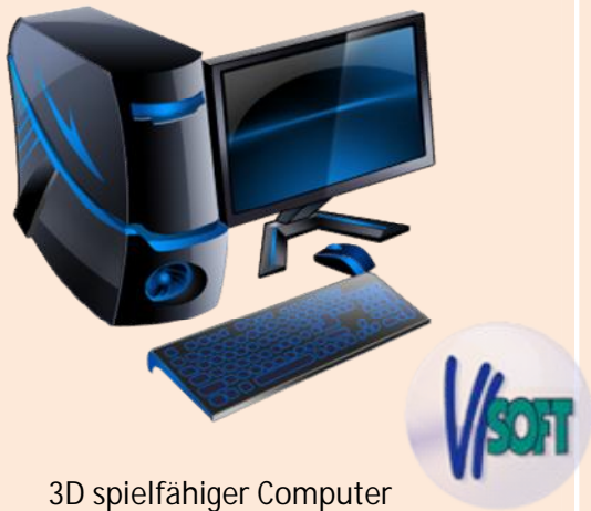
3D spielfähiger Computer