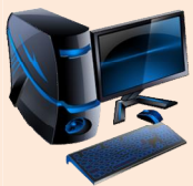
3D spielfähiger Computer

Prozessor: Quad ab 3,0 GHz / Intel I7 920 ab 2,6 GHz Speicher: ab 4 GB RAM Festplatte: ab 300 GB Monitor: ab 19 Zoll System: Windows XP/ Windows Vista/ Windows 7 (Alle Versionen in 32 oder 64 Bit) DVD ROM, USB Steckplatz Internetanbindung: DSL